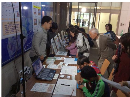
図 1 出展の様子

総合研究棟 1 階玄関ホールに場所を借りることが出来たおかげで、午前 10 時の開始時刻から終了の午後 3 時まで、全く途切れることなく親子連れがやってきて、カード作りや展示機器の操作体験を楽しんだ。パソコンで上映した全盲児の点字打刻の様子（動画）には、そのあまりの速さに驚いていた様子であった。